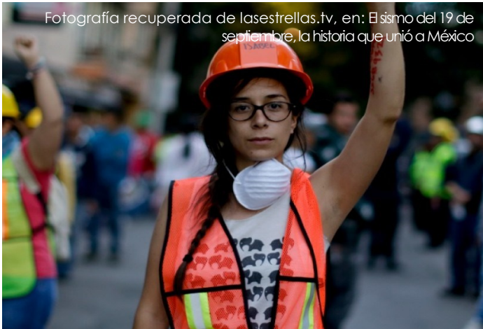
Fotografía recuperada de lasestrellas.tv, en: El sismo del 19 de septiembre, la historia que unió a México

hombro a hombro, hasta que encontraron a todos y cada uno de los reportados ausentes.