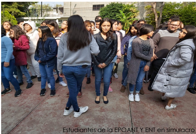
Estudiantes de la EPOANI Y ENT en simulacro

Gran lección nos ha dado la juventud mexicana; personas a las que en lo personal veía con recelo, pensando que vivían tan sólo el hoy, sin preocupación ni ocupación; pero sin lucro ni ganancia han demostrado con orgullo lo que implica ser parte de una ciudadanía responsable y comprometida con los problemas que afectan a nuestra población.