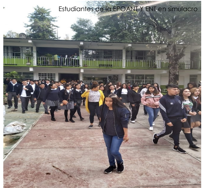
Estudiantes de la EPOANI Y ENT en simulacro

En este sentido y con la intención de prevenir muertes a causa de movimientos telúricos, el día 19 de septiembre del 2019 a las 10:00 horas, se efectuó